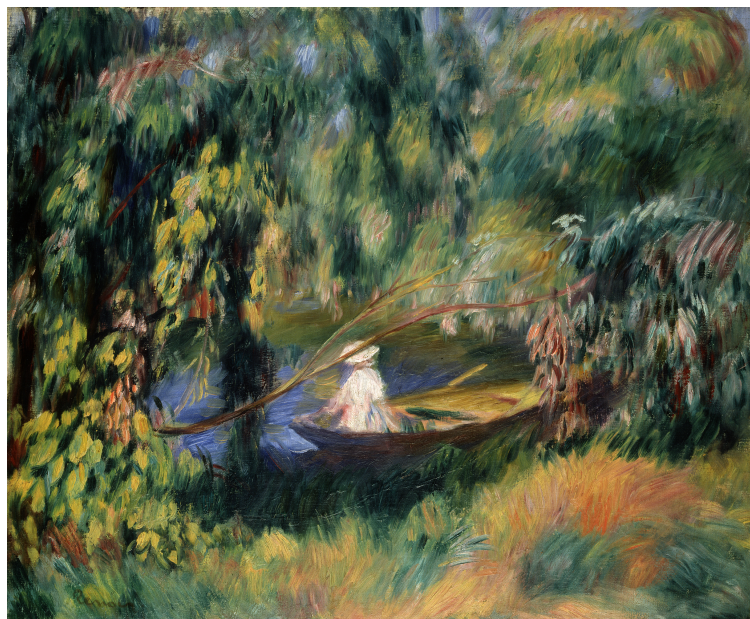
Auguste Renoir, La barque , vers 1878 Huile sur toile, 54,5 65,5 cm Museum Langmatt, Baden Südostschweiz Print AG, Chur

Chefs-d'œuvre du Musée Langmatt. Boudin, Renoir, Cézanne, Gauguin... , 28.06 – 03.11.2024 Mardi à dimanche de 10h à 18h, jeudi jusqu'à 21h