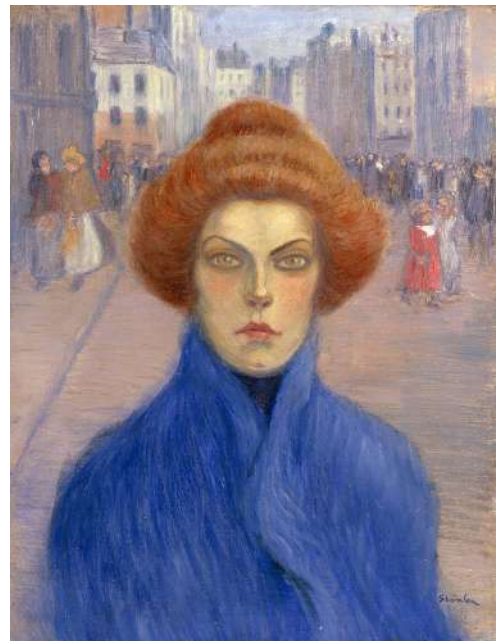
Théophile-Alexandre Steinlen, La Rentrée du soir , 1897 huile sur toile, 65 x 50 cm Association des amis du Petit Palais, Genève

Installé à Paris en 1881, Steinlen fréquente le cabaret du Chat Noir de Montmartre, pour lequel il réalise la célèbre affiche La Tournée du Chat Noir (1896). Si le thème des chats fait sa réputation, ce sont d'abord et avant tout les sujets sociaux qui animent cet artiste engagé. Sans relâche, ses dessins, estampes et peintures décrivent la dureté de la vie du monde ouvrier, les conditions misérables des prostituées et des vagabonds, ou encore l'âpreté des « petits métiers » de la capitale française à la fin du 19 e siècle. Pacifiste, il dénonça aussi avec force les horreurs et les destructions de la Grande Guerre.